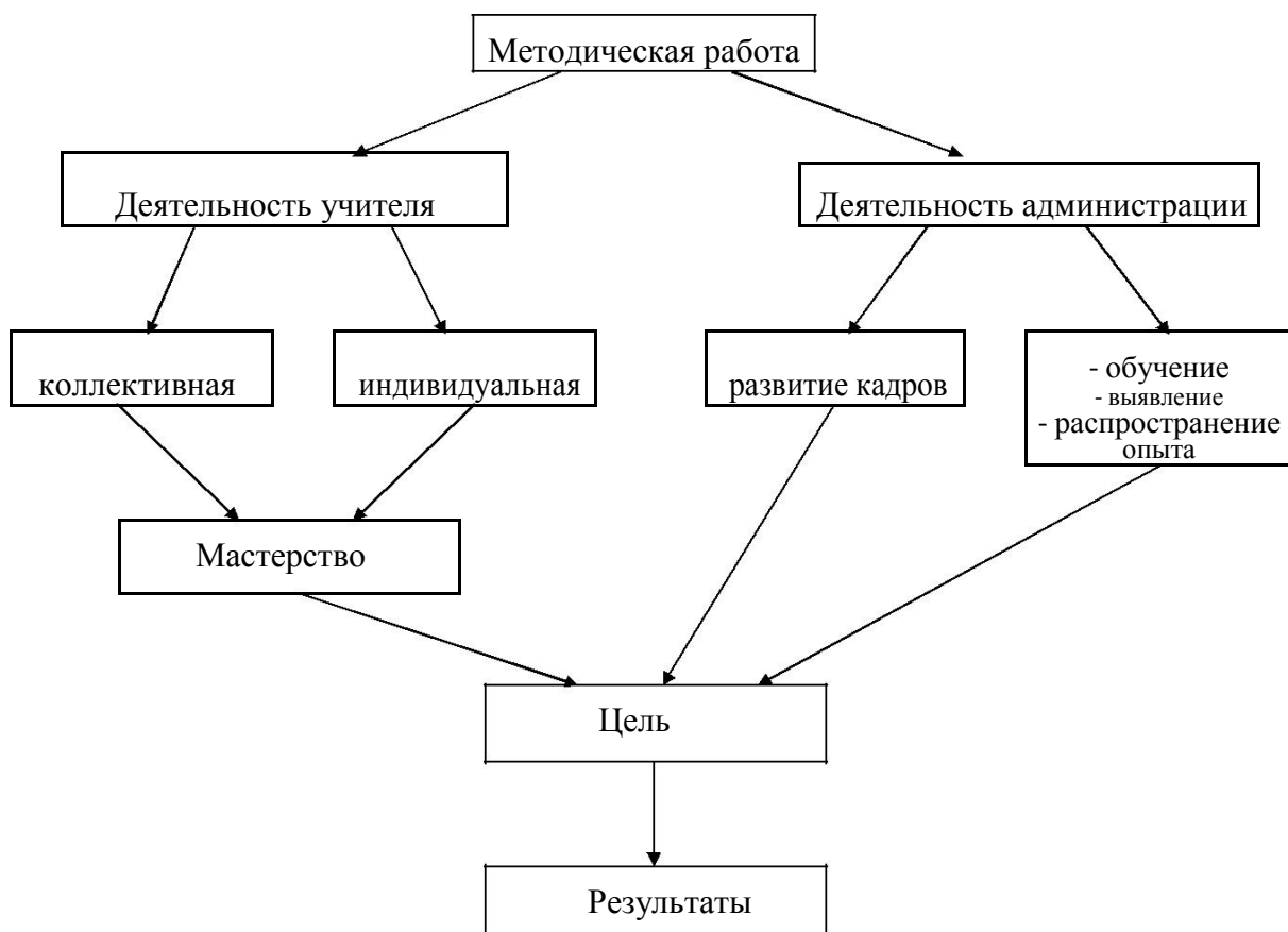
СХЕМА МЕТОДИЧЕСКОЙ РАБОТЫ В ШКОЛЕ